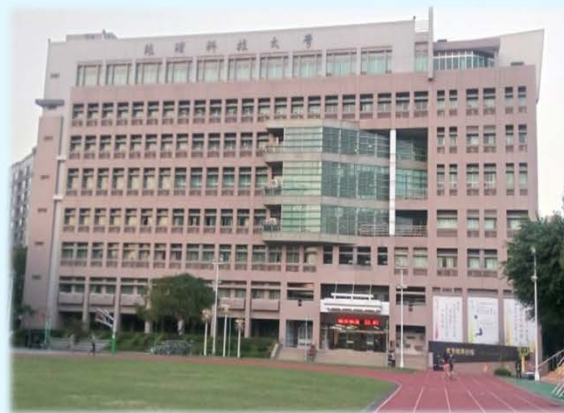
▲財務金融系位於綜合教學大樓四樓