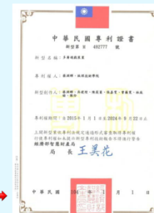
投資理財遊戲專利證書 →